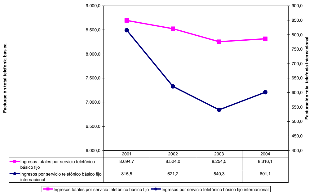
Ilustración 2 - Evolución de la facturación por servicios de telefonía básica

A esta pérdida de cuota de mercado se une la tendencia observada en los últimos años que refleja la pérdida suave pero constante de ingresos por tráfico internacional, en línea con la moderación en el crecimiento en general de los ingresos por servicios de telefonía básica (excluyendo las llamadas de fijo a móvil y a los números de inteligencia de red que son las únicas líneas de negocio que registran incrementos de facturación).